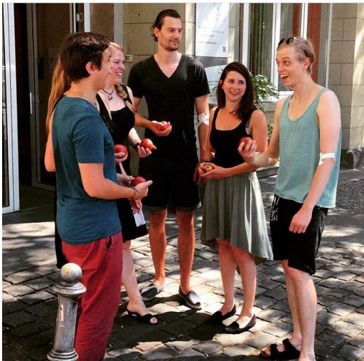
Zeige deine Teamaktion auf Instagram.