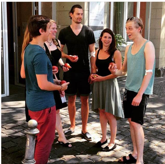
Zeige deine Teamaktion auf Instagram.