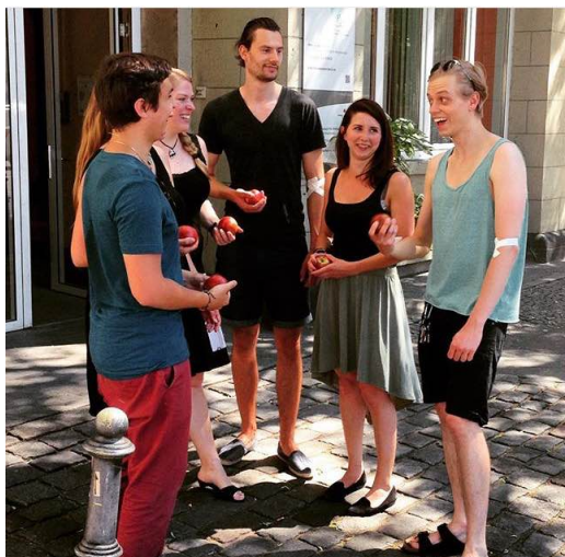
Présente l'activité de ton équipe sur Instagram.